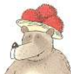
Die Sonne auf dem Pelz ...

Kosten 20,00 € pro Rucksack. Kaution 50,00 € pro Rucksack.