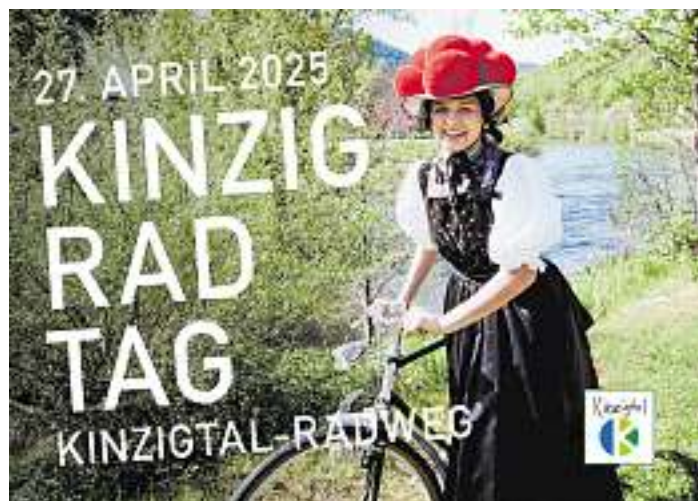
Kinzig Rad Tag

Weitere Informationen zum Gewinnspiel und das vollständige Rahmenprogramm gibt es online unter www.kinzigtalradweg.de oder im Programmflyer, der unter anderem in der Tourist-Information Wolfach erhältlich ist.