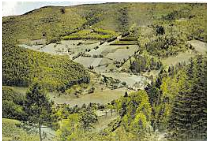
Bild 1006: Nochmals ein historisches Bild von der Walke mit Blick in Richtung Spinnerberg (wie Bild Nr. 1005) und zur Villa Stoesser, dem heutigen MFO. Allerdings stammt die Aufnahme aus den vierziger oder fünfziger Jahren des vorigen Jahrhunderts wie Bild Nr. 1003. Es gibt noch keine Bebauung zwischen „Hirschen“/Schnetzer und dem Weberbauernhof. Am Spinnerberg breitet sich noch Laubwald und Heckenbosch aus. An der Straße in den Rankach stehen nur vereinzelt einige Häuser.