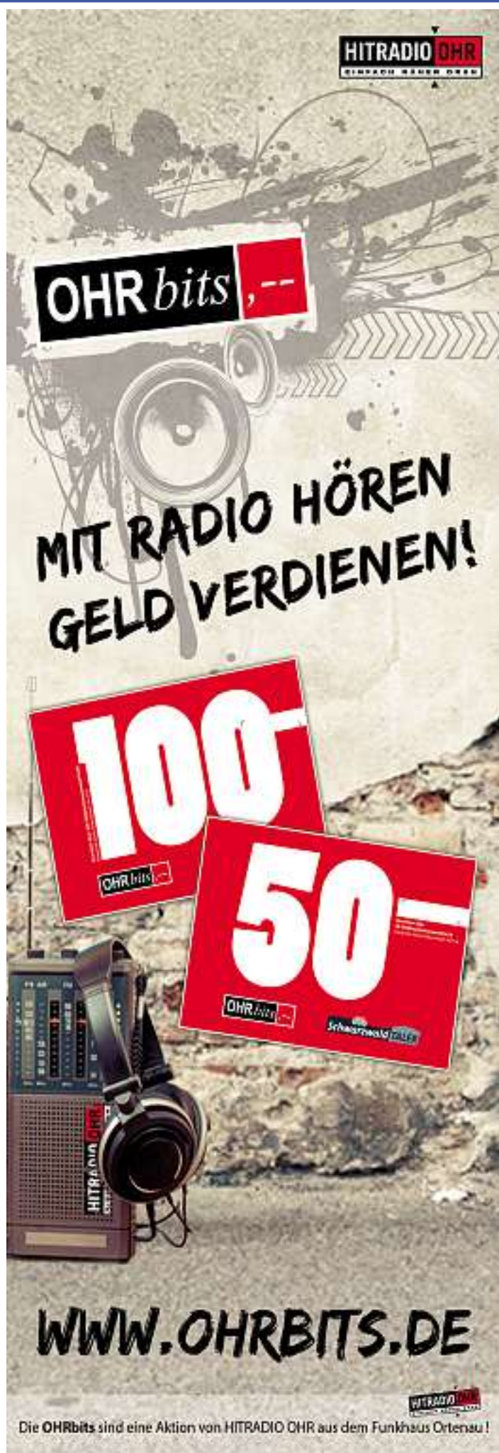
Die OHRbits sind eine Aktion von HITRADIO OHR aus dem Funkhaus Ortenau!

Termin(e): So, 07.09.25; 10.30 Uhr bis 15.30 Uhr Anforderung: Mittelschwer Treffpunkt: Bushaltestelle Lotharpfad (B 500) Zielgruppe: Interessierte ab 8 Jahren Anmeldung: Anmeldung erforderlich bis 04.07.25, 12 Uhr Referent: Nationalpark-Ranger