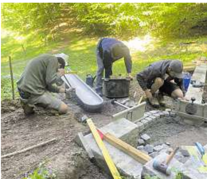
Wasserbahn im Weiherloch

Ein Anschreiben erhalten nur diejenigen Eigentümer/innen, deren Gebäude in den förderfähigen Ausbaubereichen liegt. Dies ist abzugrenzen von den Ausbaubereichen der „Unsere Grüne Glasfaser“ (UGG). Auf der Webseite der Breitband Ortenau ( https://www.breitband-ortenau.de/abfrage ) können die Eigentümer/innen selbst prüfen, ob ihre Adresse zum geförderten Ausbaubereich gehört.