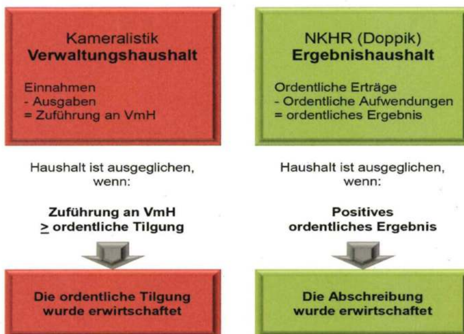
Grafik 2: Anforderungen an den Haushaltsausgleich

Die Regelungen zum Haushaltsausgleich spielen sowohl für die Beurteilung der finanziellen Leistungsfähigkeit der Stadt Wolfach als auch für die Genehmigungsfähigkeit des Haushalts eine wichtige Rolle. Mit der Einführung des Neuen Kommunalen Haushalts- und Rechnungswesen verändern sich aber auch die Rechengrößen und Beurteilungskriterien des Haushaltsausgleichs nachhaltig. Als Konsequenz aus dem Prinzip der Generationengerechtigkeit und dem buchhalterischen Ansatz des Ressourcenverbrauchskonzepts, ist im NKHR der Gesamtergebnishaushalt bzw. die Gesamtergebnisrechnung für den Haushaltsausgleich maßgebend . Der NKHR-Haushalt ist in Planung und Rechnung dann ausgeglichen, wenn (unter Berücksichtigung von Fehlbeträgen aus Vorjahren) die ordentlichen Erträge die ordentlichen Aufwendungen decken. Damit wird der Haushaltsausgleich gegenüber der in der Kameralistik geltenden Systematik zur deutlich höheren Hürde. Die enormen Vermögenswerte, welche die Kommunen zur Erfüllung ihrer Ausgaben vorhalten, gehen einher mit hohen Abschreibungen, welche zukünftig erwirtschaftet und finanziert werden müssen. Dies war bisher nicht der Fall. Abschreibungen wurden im Verwaltungshaushalt nur teilweise und nicht ergebniswirksam gebucht. Die im Verwaltungshaushalt ausgewiesenen „Überschüsse“ mussten zwar zur Deckung der Tilgungsleistungen im Vermögenshaushalt ausreichen, in aller Regel liegen die ordentlichen Tilgungsverpflichtungen aber deutlich unter der Summe der anfallenden Abschreibungen.