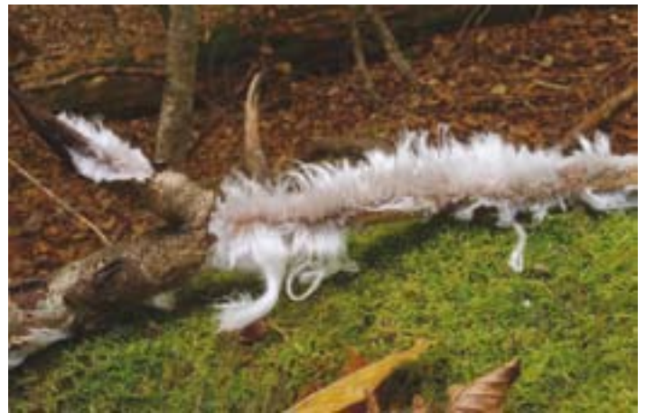
„Haareis“ auf einem Buchenast Bayerischer Nationalpark