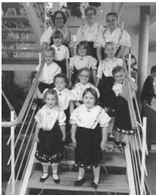
Das Bild zeigt die Kindertanzgruppe bei ihrem Auftritt im Johannes-Brenz-Heim.