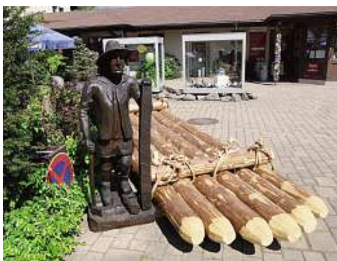
Fertiges Schaufloß bei der Dorotheenhütte