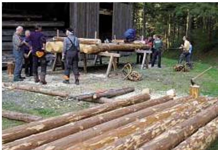
Floßbau beim Flößerschuppen unterhalb der St. Jakobskapelle