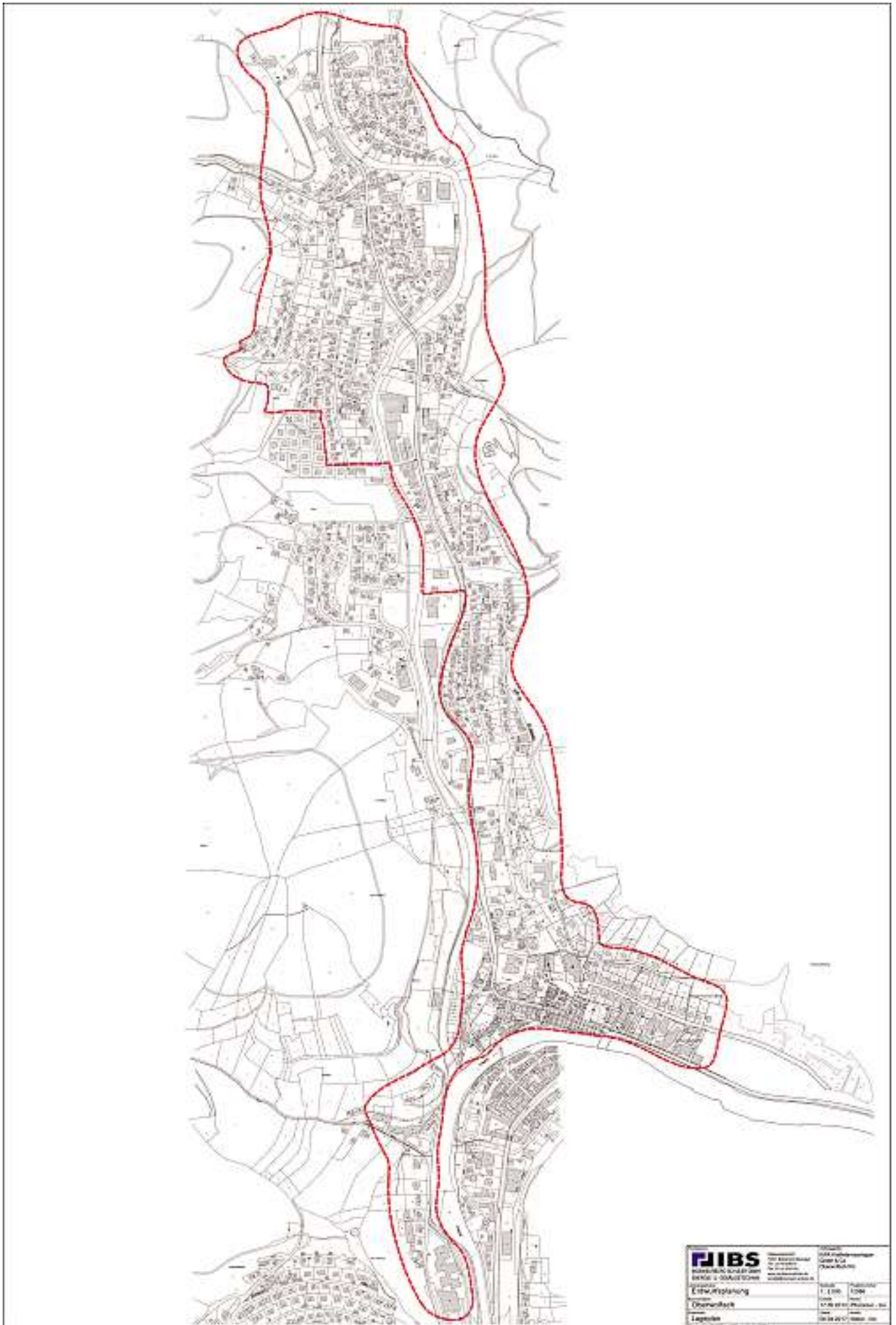
Abgrenzung des Quartiers zur Erstellung eines energetischen Konzeptes