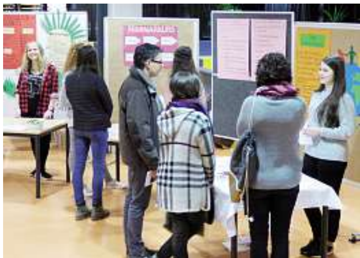
Im Bild: Schülerinnen des SG präsentieren ihre Seminar-kursarbeiten

Text: Kathrin Haberer, Bild: Pascal Rosen