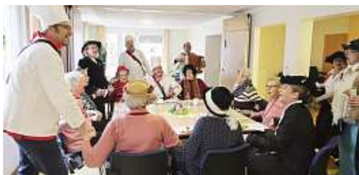
Kaffeetanten und Trommler sorgten musikalisch für nährische Stimmung, wie hier bei der Schunkelrunde.

Somit war ein guter Einstieg für die älteren Mitbürger/innen in die „tollen Tage“ gelegt worden.