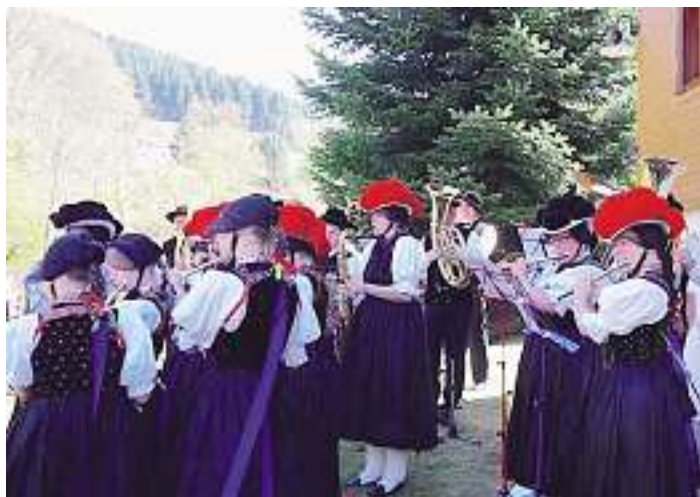
Der Musikverein Trachtenkapelle Kirnbach e. V. in Aktion

Alle Musikerinnen und Musiker freuen sich bereits heute darauf, mit Ihnen einen stimmungsvollen Schwarzwald-Abend zu verbringen.