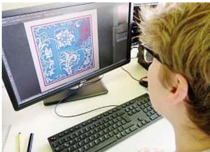
Schüler des 1BK1T in Wolfach coloriert eine Initiale für die Gutenberg-Bibel am PC

Die Schüler stellen Ihre eigenen Werke in Kürze im Schulhaus aus. Auch Gutenberg hätte sicher seine Freude an den kreativen Arbeiten der Schüler gehabt!