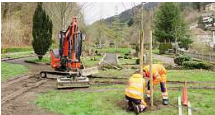
Städtische Bauhofmitarbeiter beim Pflanzen der Bäume

Auf dem neuen Friedhof in Wolfach wurde in den vergangenen Tagen ein Grabfeld für Baumbestattungen vorbereitet. Ein vorhandener Weg wurde zurückgebaut und drei Bäume wurden von städtischen Bauhofmitarbeitern gepflanzt, unter denen voraussichtlich ab Herbst Urnenbestattungen möglich sind.