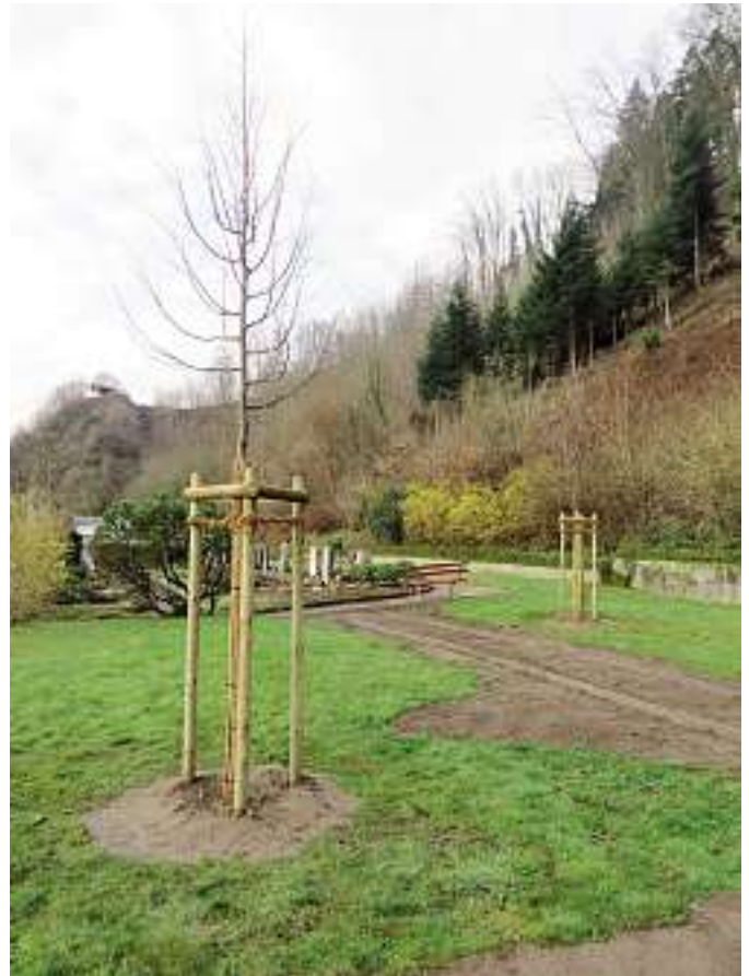
Das Grabfeld mit den Bäumen auf dem neuen Friedhof in Wolfach