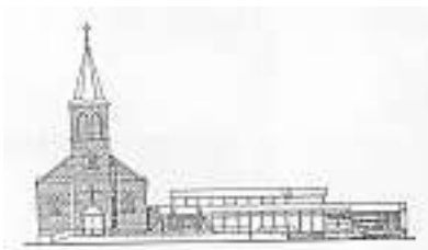
Veranstalter: Ev. Kirchengemeinde Wolfach