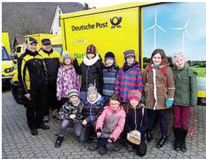
Cleverle AG – Post