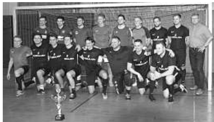
Sehr zur Freude der lautstark feiernden Sieger, darf der Pokal jetzt endgültig in den Pokalschrank des alten Kamuffels 2.