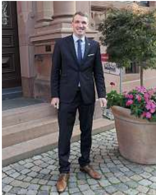
Bürgermeister Thomas Geppert

In der neu gewählten Position vertritt Geppert damit den Kreisverband Ortenaukreis in weiteren Gremien des Gemeindetags Baden-Württemberg, u.a. im Landesvorstand. Über seine einstimmige Wahl aus dem Kollegen/Innen-Kreis heraus freute sich Geppert sehr und sagte zu, sich in den überregionalen Gremien bestmöglich für die Belange aus dem Heimat-Kreisverband einsetzen zu wollen.