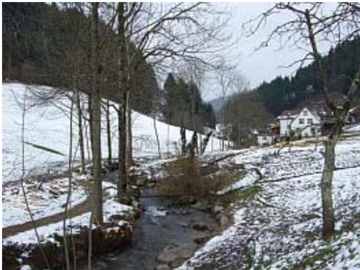
Fläche vor der Maßnahme...

Es wäre wünschenswert, dass weitere Anlieger entlang von Gewässerrandstreifen dem Beispiel folgen, zumal solche Maßnahmen einen wichtigen Beitrag zur Offenhaltung unserer erhaltenswerten Kulturlandschaft darstellen.