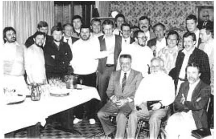
1988 fand unter großer Resonanz das letzte Treffen in Wolfach statt.