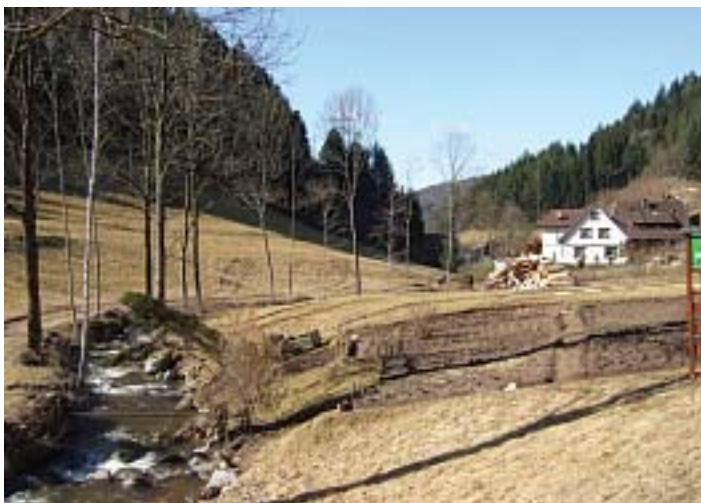
...so sieht der Bereich heute aus